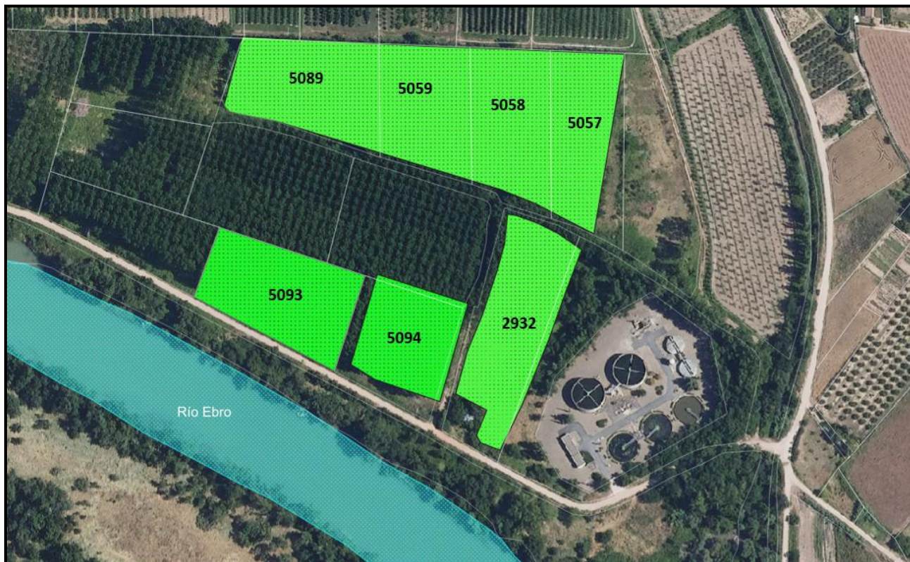
ORTOFOTO 1: Vista de la superficie objeto de corta.

Los límites de la superficie de corta quedan definidos en las siguientes imágenes: