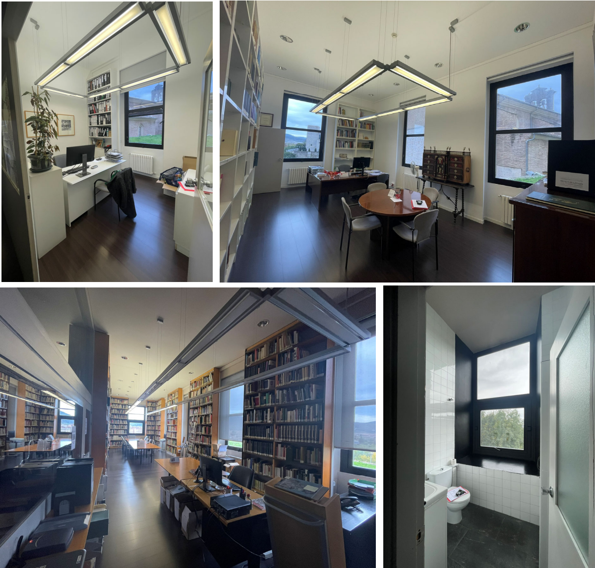
INTERIOR PLANTA PRIMERA (OFICINAS, BIBLIOTECA, ASEOS)