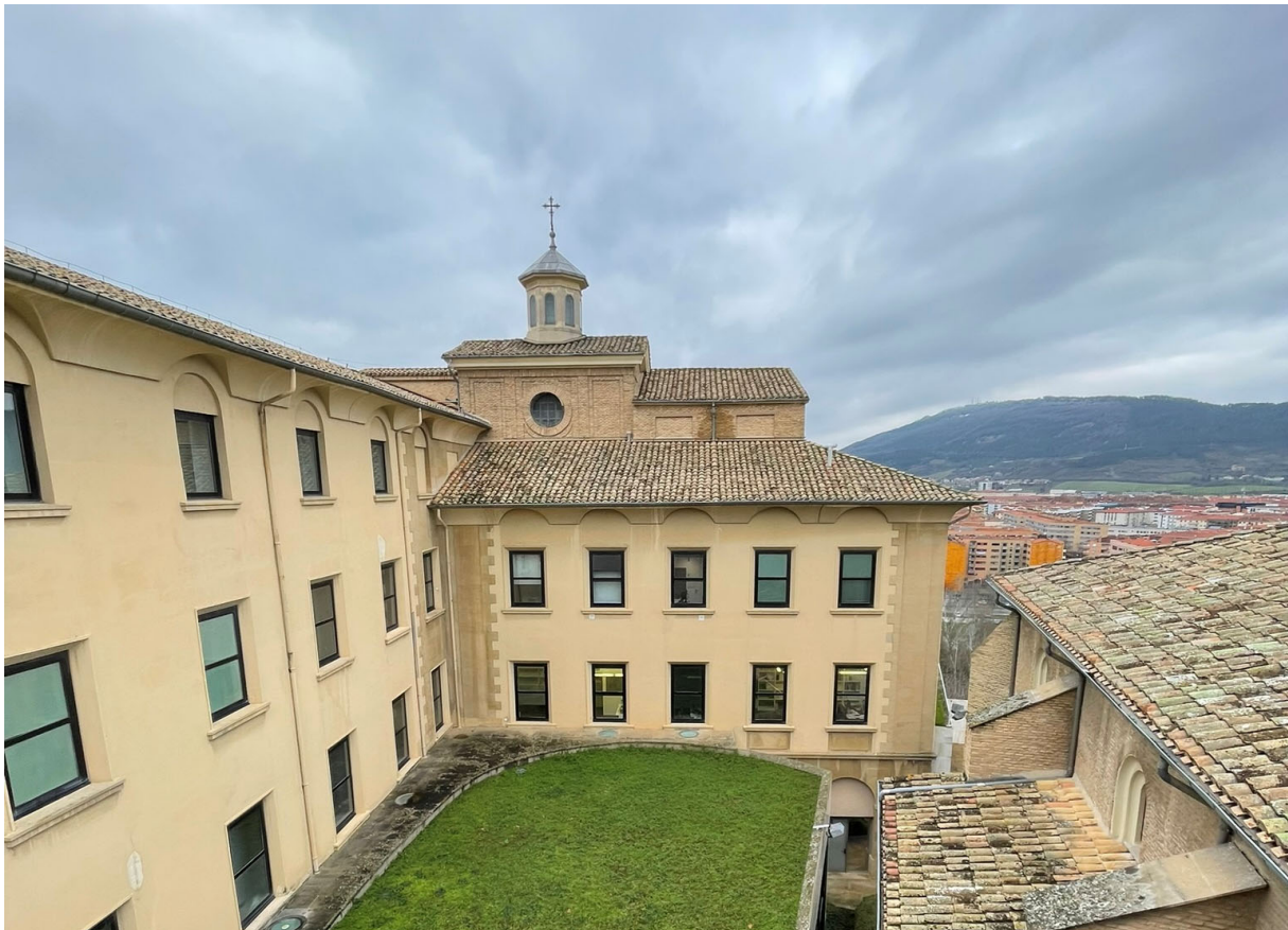
ALZADO SURESTE (OFICINAS) EN EL PATIO INTERIOR DEL MUSEO