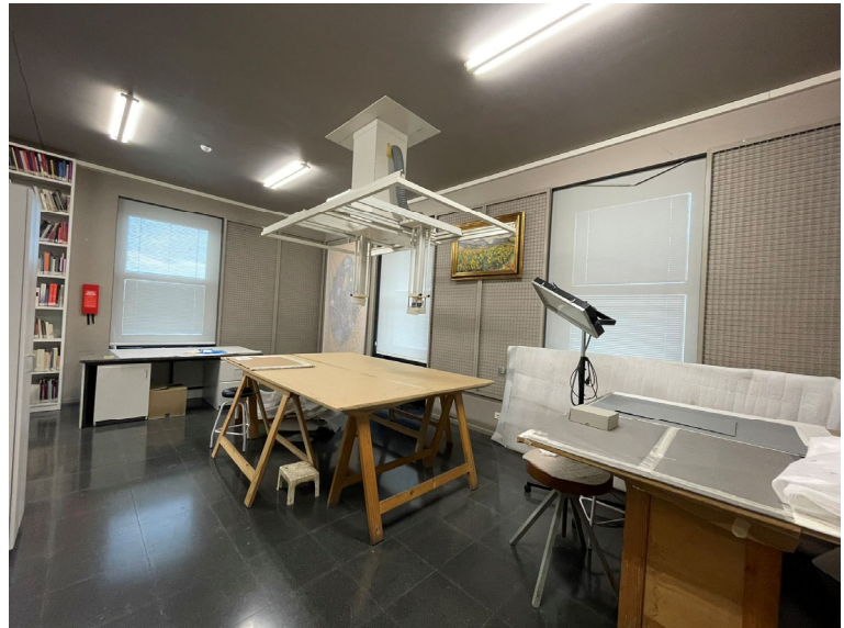
INTERIOR PLANTA SEGUNDA (OFICINAS Y TALLER RESTAURACIÓN)