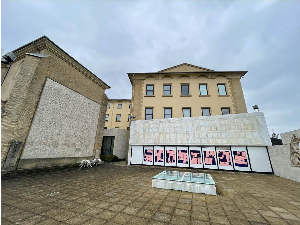
ALZADO NORESTE (OFICINAS) EN EL PATIO INTERIOR DEL MUSEO