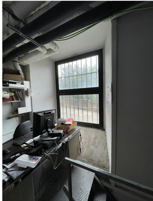
INTERIOR PLANTA BAJA (VESTUARIOS Y SALAS INSTALACIONES)