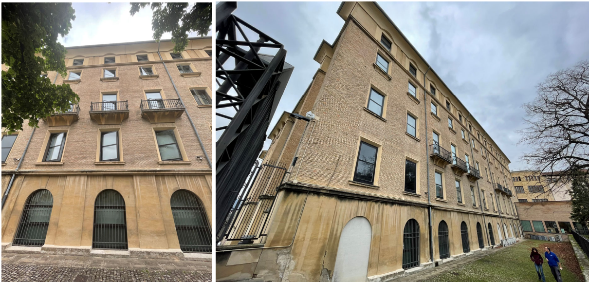
ALZADO SUROESTE (SALÓN DE ACTOS)