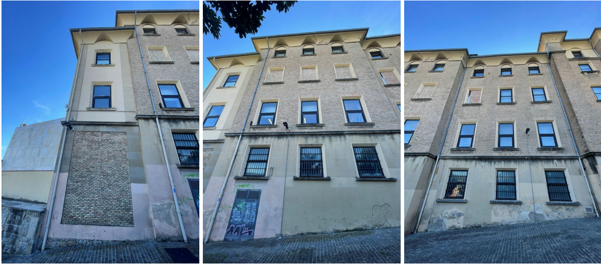
ALZADO NOROESTE (OFICINAS) EN EL PASEO DE RONDA