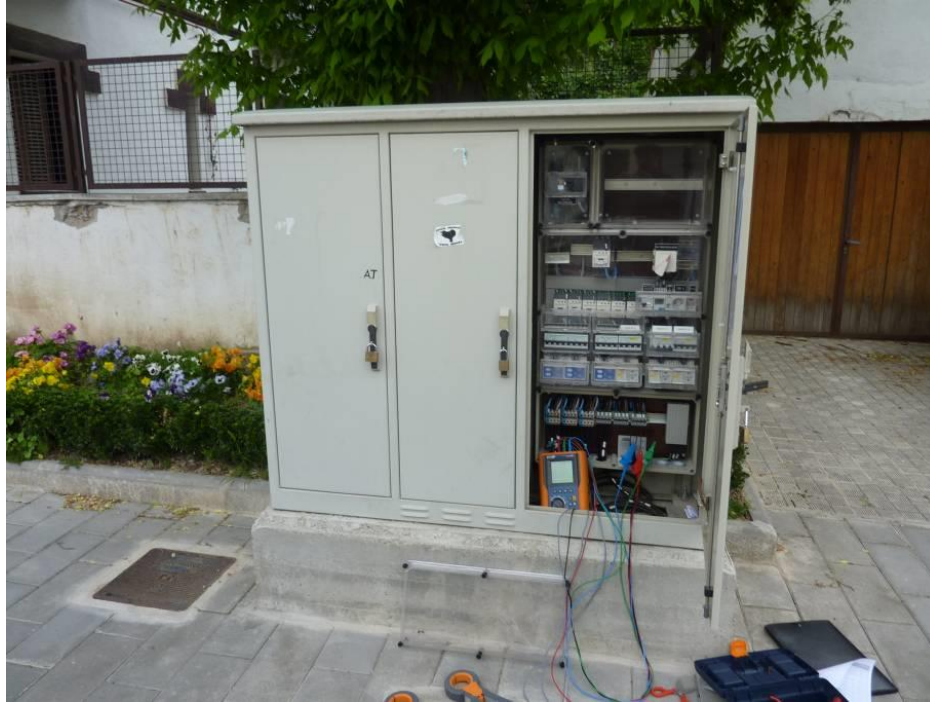
Detalle del cuadro nº 6

Se trata de un cuadro de tipo triple módulo con reductor de flujo en cabecera. En perfectas condiciones de uso.