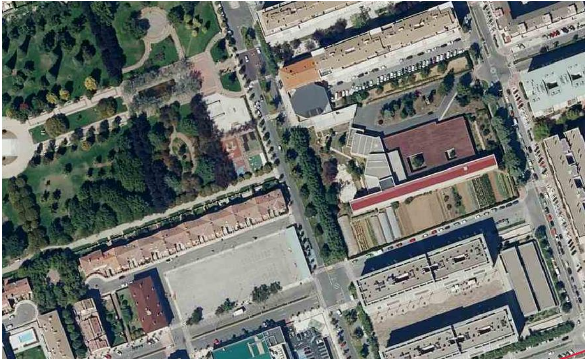
Ortofoto de la zona este del Parque de la Constitución.

La actuación prevista se localiza en el Parque de la Constitución, junto a una zona de skate-park y pista cubierta de juegos infantiles.