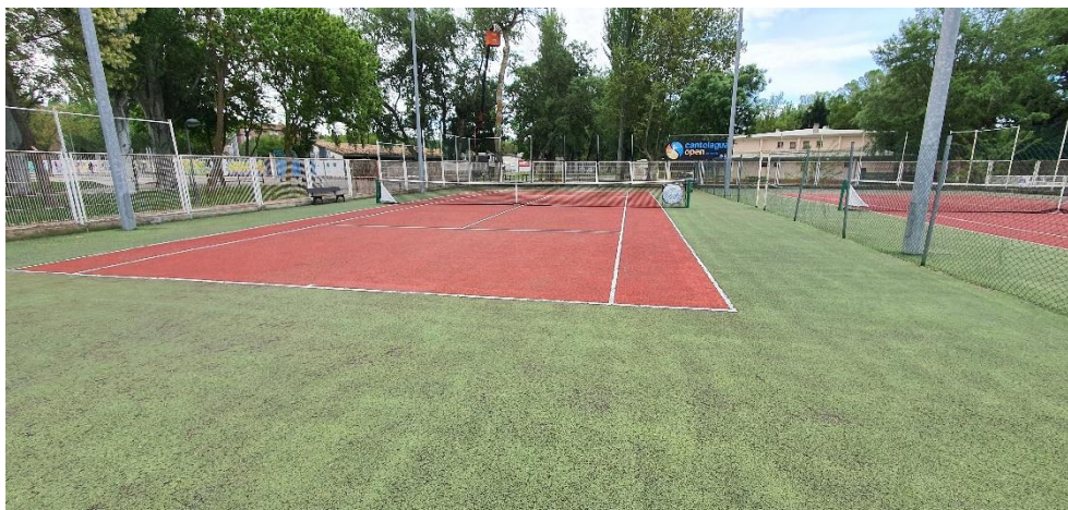
Estado de pista 1

Se adjunta fotografías del estado actual.